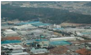
中津川中核工業団地