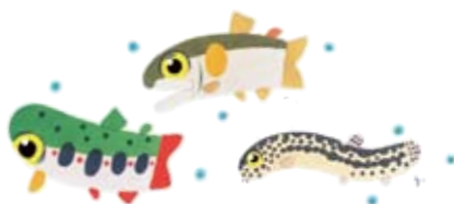
あいちがわ AMAGO / AYU / AJIMEDOJO