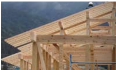
東濃松の家（建前風景）