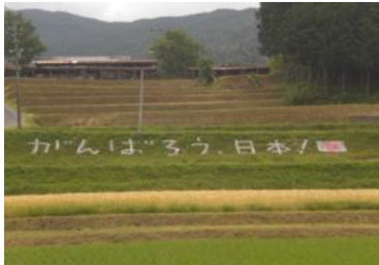
「がんばろう 日本!」の文字(植苗木地区)

本年度は、「ふくおか地域づくりビジョン」にそって、みなさんと一緒にふくおか地域の活性化のために活動していきます。