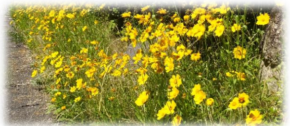
▲ オオキンケイギク