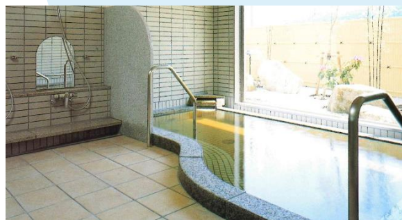
▲浴槽（源泉名：鶴寿の湯）