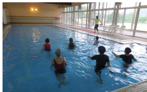
▲運動浴槽（公民館講座水中運動のようす）