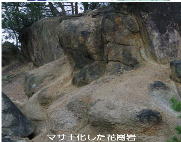
マサ土化した花崗岩