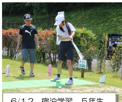
6/1,2 宿泊学習 5年生