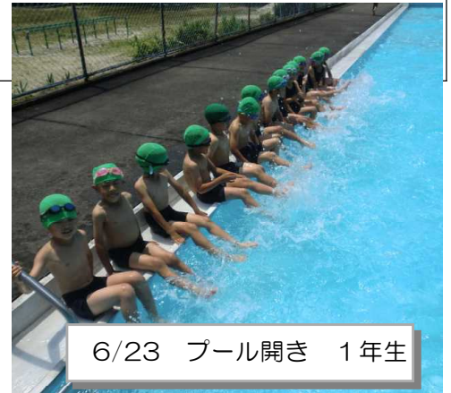
6/23 プール開き 1年生