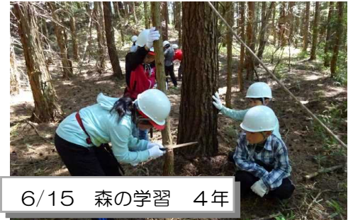
6/15 森の学習 4年

2学期になると、今度は運動会で初めての係会に参加します。わたしは応援団です。初めてのことがたくさんあるけれど、5年生や6年生の姿を見たり、教えてもらったりしながら、責任をもって活動していきたいと思います。がんばります。