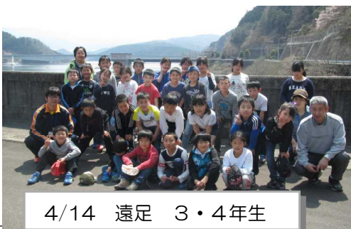
4/14 遠足 3・4年生

と言っていました。私のべんとうは、お母さんが作ってくれました。すごくおいしかったです。おかしは、よしまるやで買った物で、その中で四つ、当たりが出ました。グループで遊んで帰りました。