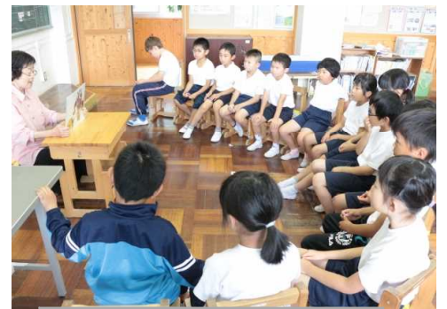
6/26 読み聞かせ 2年生