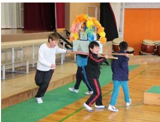
ステップ「ゴーゴーステップ」 1年生「ビー玉ころりん」