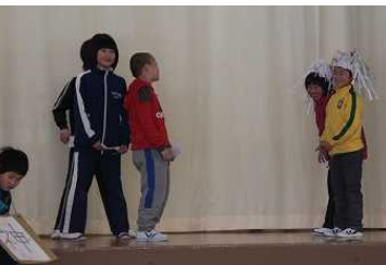
2年生「やさしいおふだ」