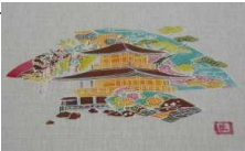
6/15 友禅染に挑戦 6年生