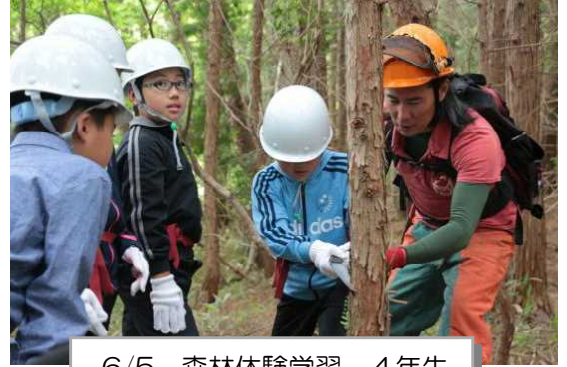
6/5 森林体験学習 4年生

最後に、課題です。僕は一学期は、自分から積極的に動くことがなかなかできませんでした。二学期は運動会があります。四年生は係の仕事もあるので、言われてからではなく、自分から積極的に動きたいです。