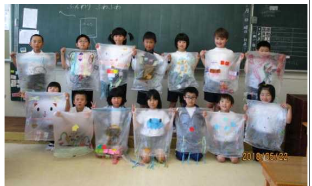
5/22 図工「ふんわりふわふわ」 3年生