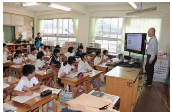
6/30 NIE新聞学習 6年生

これからは、委員会の仕事は今まで通り忘れずにして、クラスの係の仕事も忘れずにするようにしたいです。そして、苦しい算数でも他の苦手な教科も、間違えても何度でも解きなおして、それでも分からなかったら先生や友達に聞いたり、自分勉強をたくさんしたりして、分からない問題が解けるように自分から進んで取り組んでいけるようにがんばりたいです。