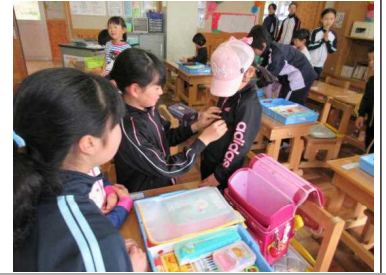
4/12 1年生のお世話 6年生