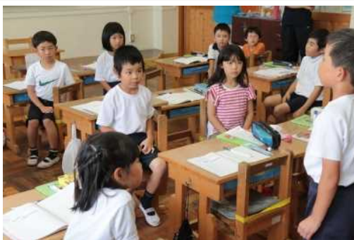
6/29 算数の授業 2年生