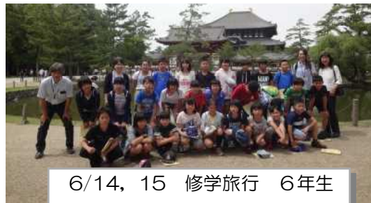
6/14, 15 修学旅行 6年生