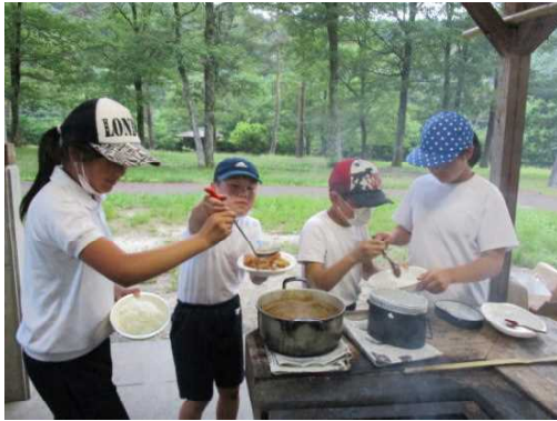
6/7,8 宿泊学習 5年生

これからも、仲間と協力することを大事にして、学級目標に向けてがんばっていきたいです。