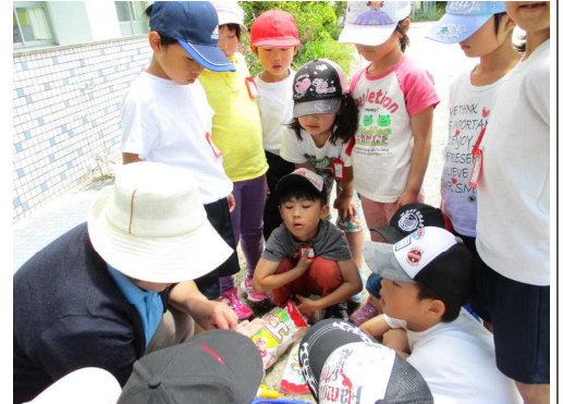
5/14 朝顔の種まき 1年生