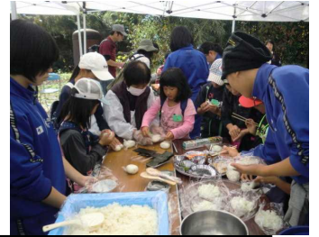
11/10(土) お宝ウォーキング