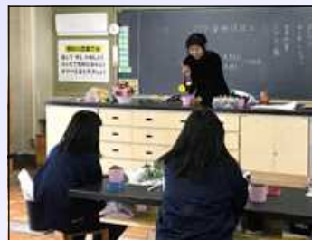
[フラワーアレンジメント]