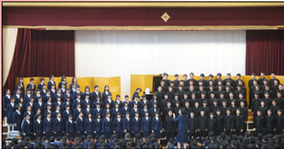
3年生学年合唱の様子

平日にもかかわらず、多くの来賓、保護者、地域の方々に学校まで足を運んでいただき、生徒達が仲間と団結し、共に頑張る姿を見ていただくことができました。