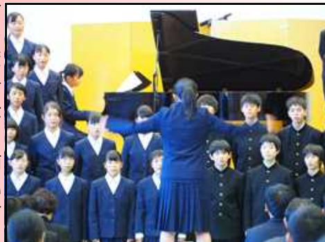
指揮者に注目して歌う姿