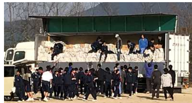
トラックいっぱいの新聞紙