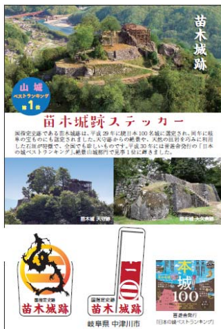
苗木城跡ステッカー（配布用）