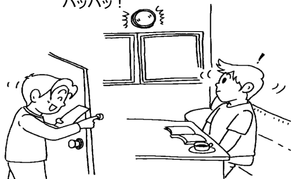
聴覚障害者用屋内信号装置