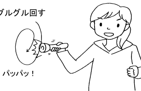
停電の時は懐中電灯も有効