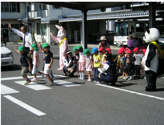
(アルピコ自動車学校での交通安全教室の様子)

中津川市では、アルピコ自動車学校と東濃自動車学校のご協力により、幼稚園・保育園の園児のみなさんに、教習所内のコースで、交通安全教室を実施していただいています。