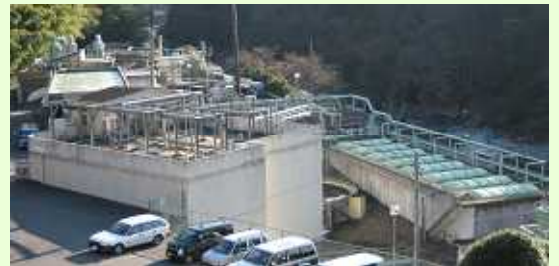
老朽化した衛生センター（北野）