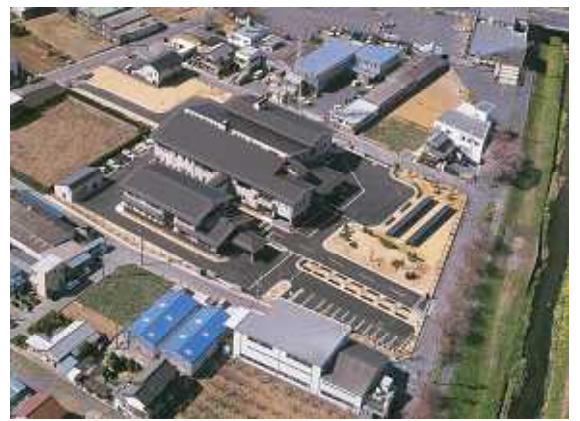
アクアクリーン佐奈川（愛知県豊川市のし尿処理施設）最新の処理設備を備え、万全な臭気対策を行っており周りの民家からの苦情はありません