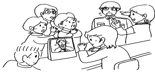
手話通訳者 災害派遣ボランティア