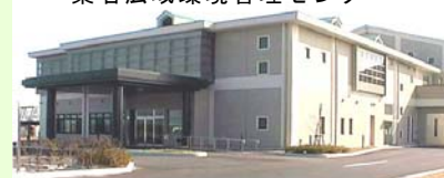
桑名広域環境管理センター

募集人数 40名 ※お申込者様には別途詳細をお知らせします。申込者多数の場合は二次開催も検討します。 ※参加費は無料ですが、昼食は各自にてお願いします。